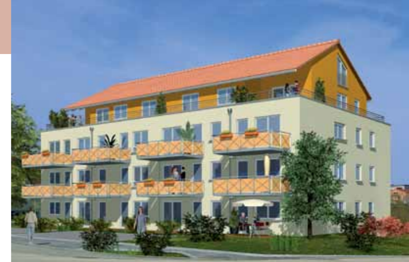
Mehrfamilienhaus Bönningheim, Schlossbergallee

Eine weitere Sorglos-Immobilie der p.b.s. Wohnbau GmbH befindet sich in Bönningheim, in der Schlossbergallee. In bester Lage situiert – ruhig, aber dennoch zentrumsnah und in unmittelbarer Nähe zur Autobahn. Dieses Mehrfamilienhaus bietet Wohneinheiten schon ab 136.800 € für die erste eigene Immobilie und ist somit ein Baustein für die Altersvorsorge.