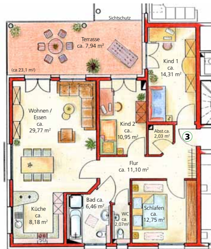
Wohnfläche Whg.3 ca. 105,56 m²

Ebenfalls in zentraler Lage, nämlich in der Obertorstraße, saniert die p.b.s. Wohnbau GmbH ein historisches Gebäude, in dem neben drei Wohneinheiten auch zwei in sich geschlossene Flächen zur gewerblichen Nutzung entstehen. „Altbausanierungen stellen für uns immer eine ganz besondere Herausforderung dar, denn wir wollen den unverwechselbaren Charme eines historischen Gebäudes bewahren, aber gleichzeitig nicht auf den